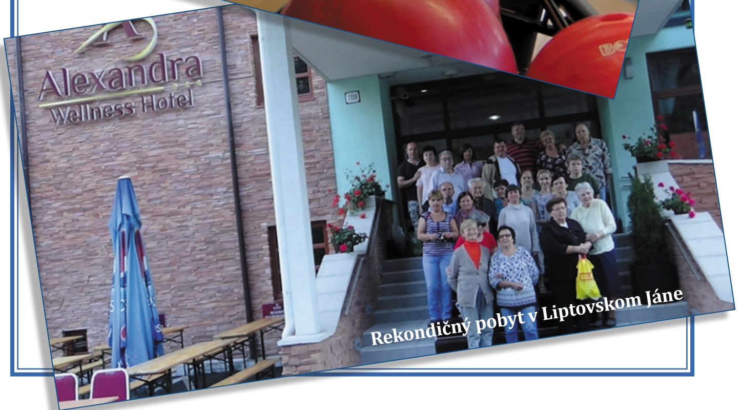
Rekondičný pobyt v Liptovskom Jáne