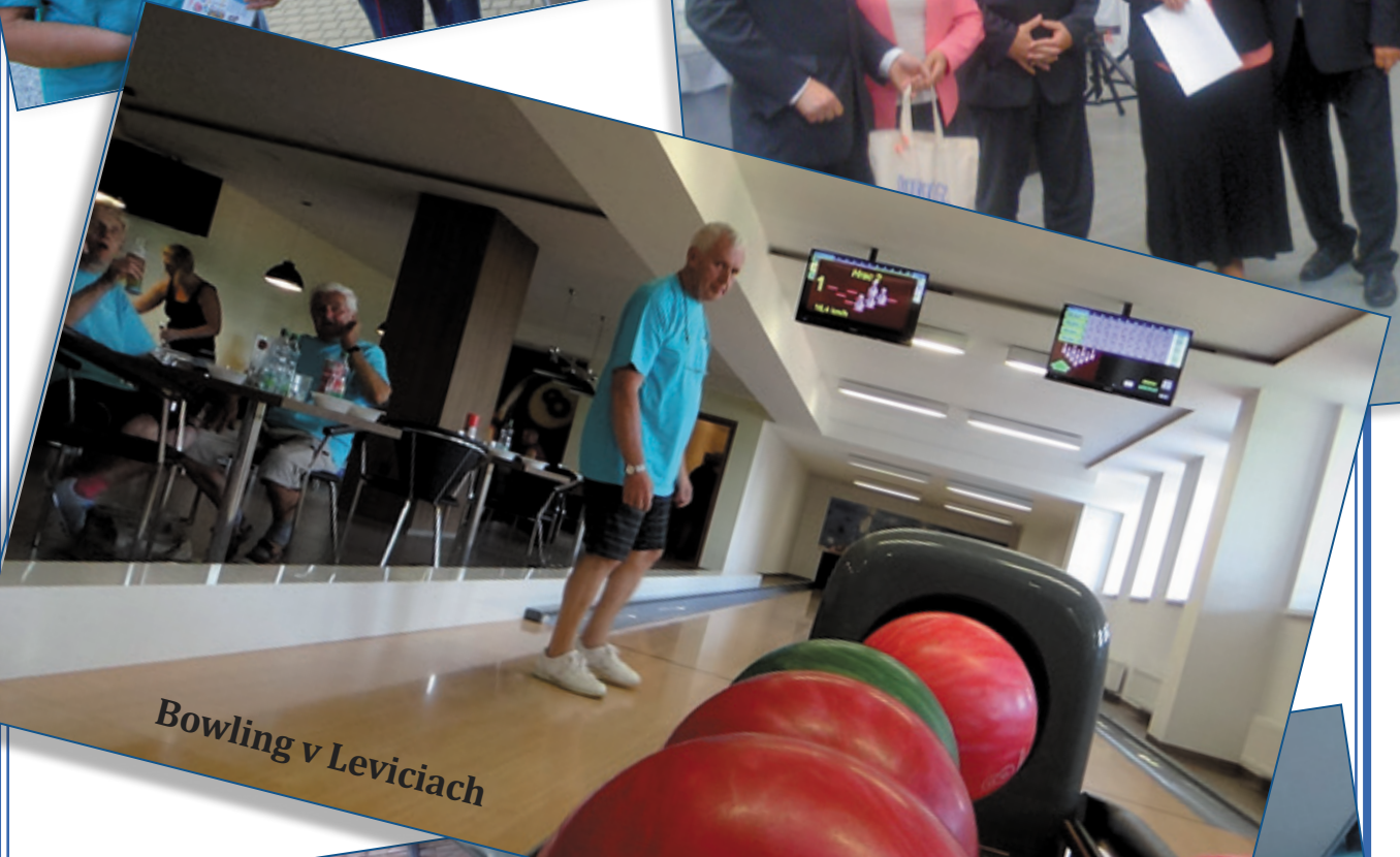
Bowling v Leviciach