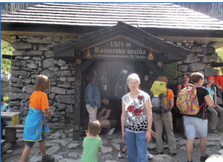
Rainerova chata 2016

„Sloboda pod nákladom“. Ukazuje nám život horských nosičov v Tatrách. Drsný, ale reálny.