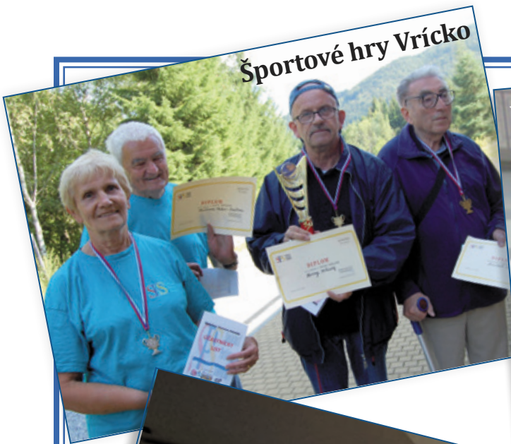
Športové hry Vrúcko